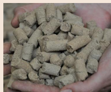
UgnCleanPellets® S 1.0