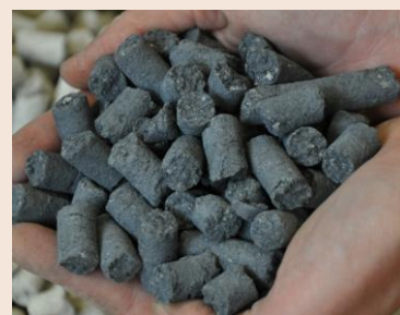
UgnCleanPellets® C 1.0

Dodatkowe informacje uzyskacie Państwo u naszego partnera w Polsce: