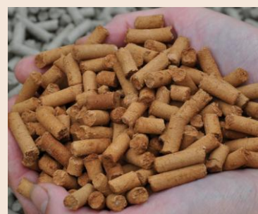
UgnCleanPellets® S 3.5-7